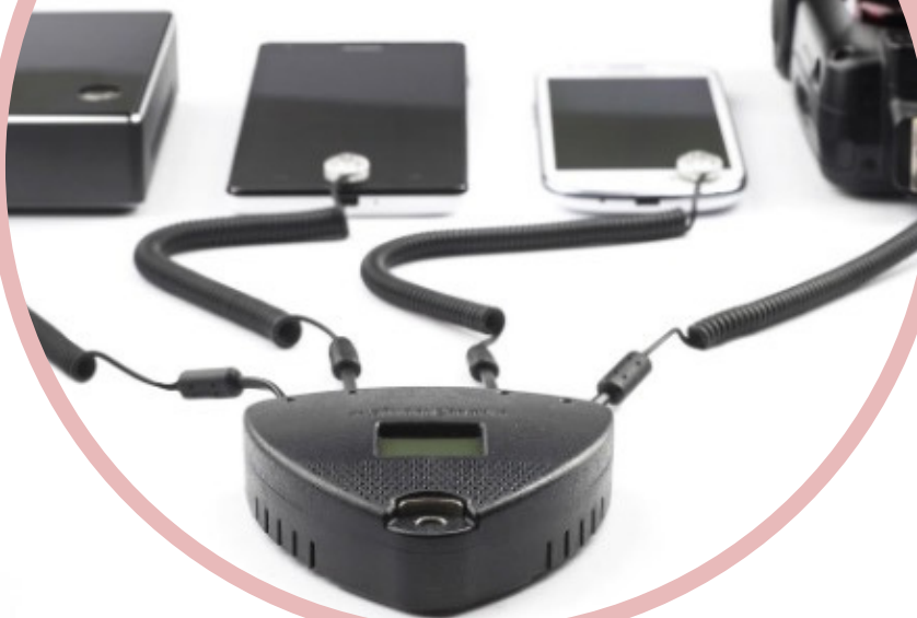
USB-A - USB-A sensor